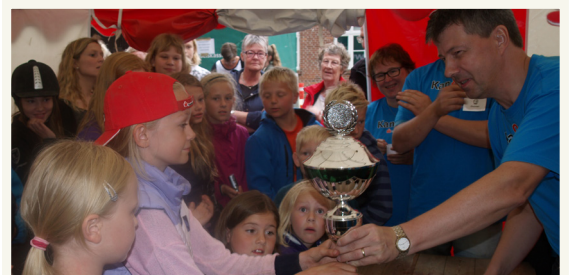
Bornedyrskue i Koldby