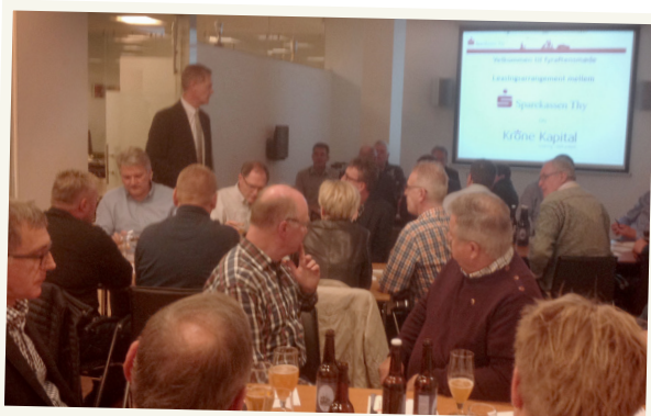
Leasingaften med ølsmagning i Struer