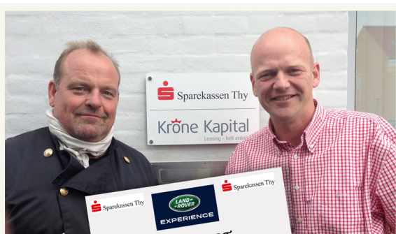
Vandt Land Rover oplevelse i Nykøbing