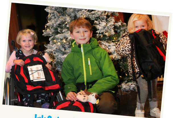
JuleSwipp-vindere i Thisted