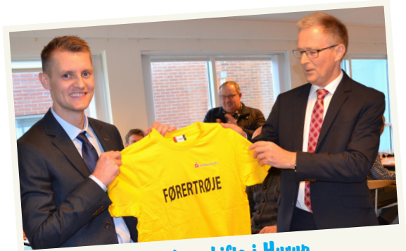
Generationsskifte i Hurup