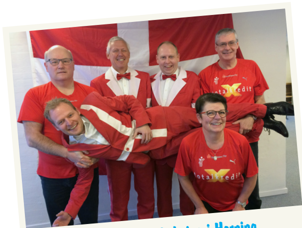
EM-håndboldopbakning i Herning