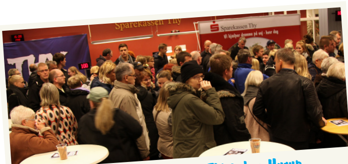
Thy Rock Café i Thisted og Hurup